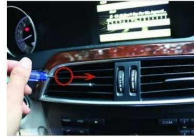
3. Setzen Sie den Druckknopf mit einem kleinen Wort in die Mitte des Luftauslasses.