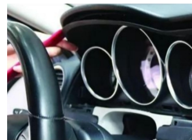
9. Hebeln Sie die Original-Bildschirmblende heraus.