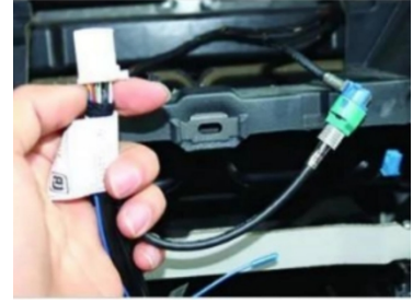
18. Schließen Sie den originalen Bildschirmkabelbaum des Fahrzeugs an