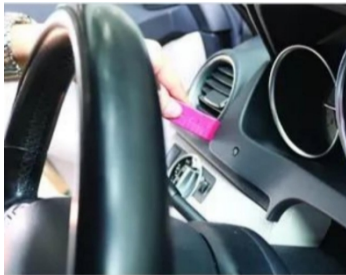
7. Hebeln Sie die Original-Bildschirmblende heraus