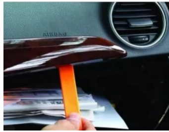
2. Pry out the air outlet panel