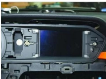
13. Hebeln Sie den ursprünglichen Fahrzeugbildschirm heraus