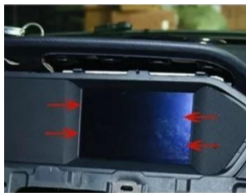
10. Entfernen Sie den Original-Bildschirmrahmen