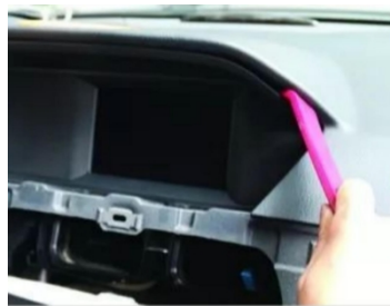
8. Hebeln Sie die ursprüngliche Bildschirmblende heraus.