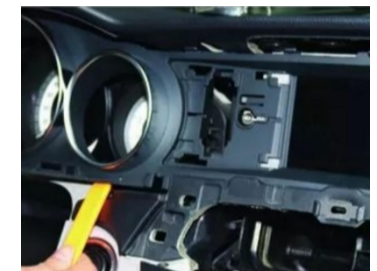
12. Hebeln Sie den Original-Fahrzeugbildschirm heraus