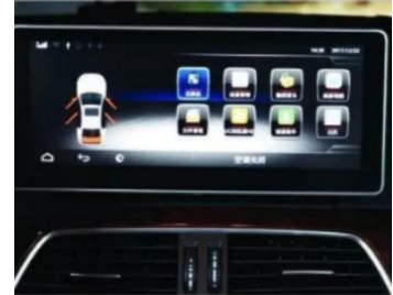
2. Wirkung nach der Installation