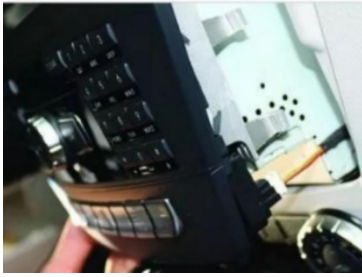
16. Ziehen Sie den Stecker der Original-Motorverkleidung ab