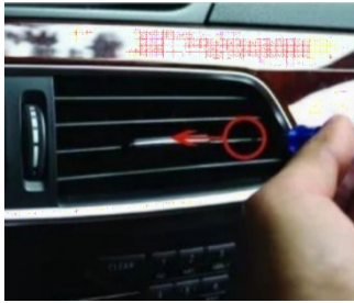
4. Setzen Sie den Druckknopf mit einem kleinen Wort in die Mitte des Luftauslasses ein