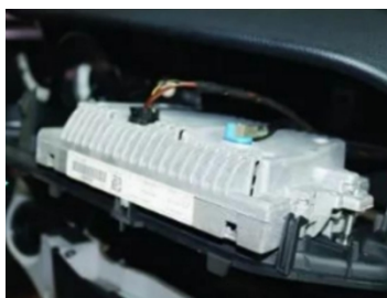
14. Ziehen Sie den Stecker des Originalbildschirms ab.