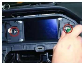
11. Entfernen Sie die Befestigungsschrauben des Original-Autobildschirms.