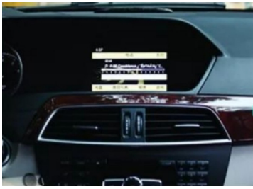
1. Zentrale Steuerung des Originals Fahrzeug