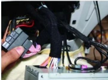
19. Schließen Sie den originalen Motor-Kabelbaum an