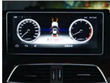
2. Wirkung nach der Installation