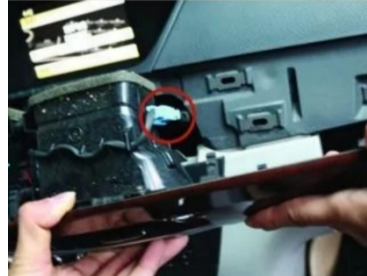
5. Ziehen Sie den Luftauslassstopfen ab.