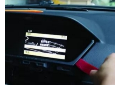
6. Hebeln Sie die Original-Bildschirmblende heraus